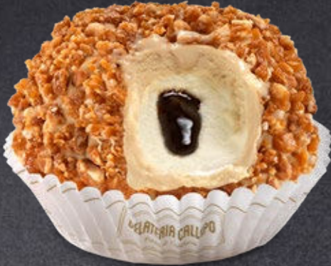
Caffè e Panna Coffee and Cream

con esclusivo cuore liquido with our exclusive fluid heart