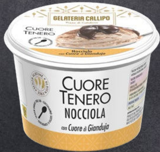
Nocciola con Cuore di Gianduja Hazelnut with Gianduja filling