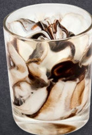
Fiordilatte variegato al Cioccolato Fiordilatte swirled throughout with Chocolate sauce