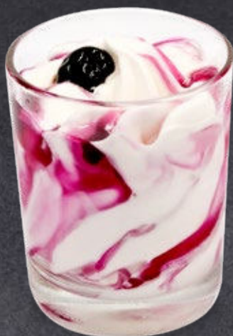
Fiordilatte variegato all' Amarena Fiordilatte swirled throughout with sour Black Cherry sauce