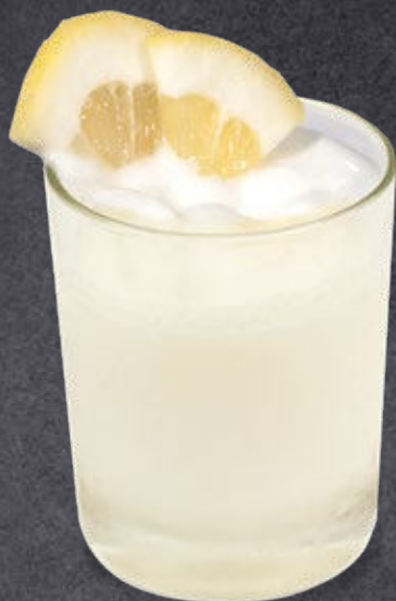
Sorbetto al limone di Sicilia Lemon from Sicily Sorbet