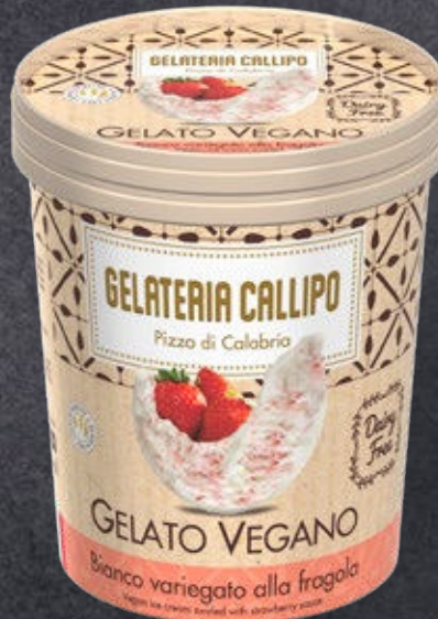
Bianco variegato alla Fragola White Vegan flavour swirled with strawberry sauce