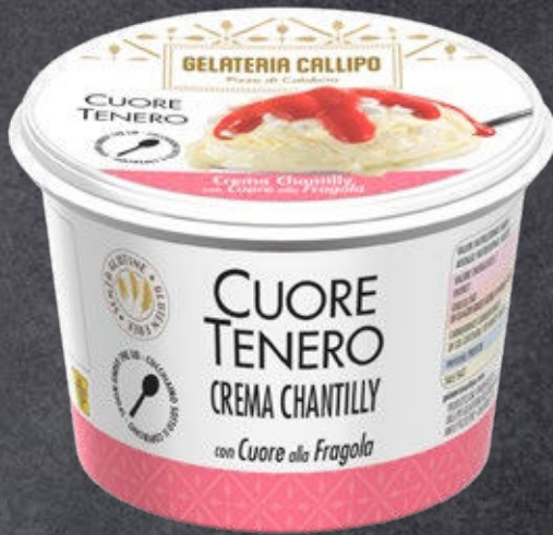
Crema Chantilly con Cuore alla Fragola Chantilly cream with Strawberry filling