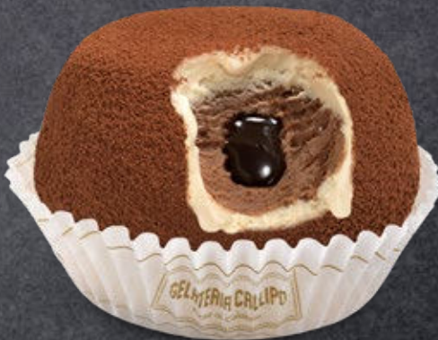
Nocciola e Cioccolato Hazelnut and Chocolate